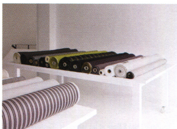
La sélection de tissus de la boutique Rue Hérold