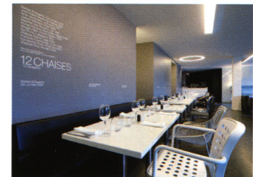
Le Saut du Loup, architecture intérieure Philippe Boisselier