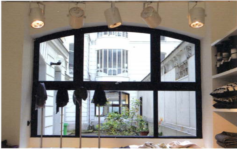
■ charlotte de la grandière