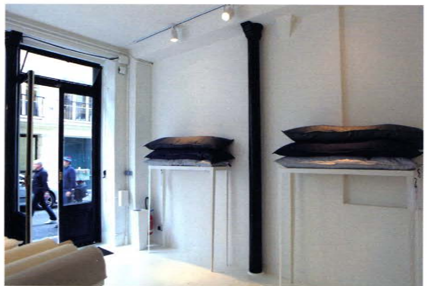
▲ 서울로 드라그랑디에르