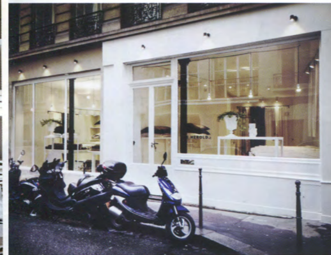
"Canicule", c'est le nom d'un des tissus présentés Rue Hérold. Plus qu'une boutique, c'est une mine d'idées, de conseils et d'inspirations, orchestrée par Charlotte de La Grandière.